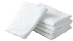
※写真はイメージです 【素材】 タオル：綿100%

《 交換回数・枚数での請求ではございません。交換必要時は病棟スタッフまでお申しつけください。 》