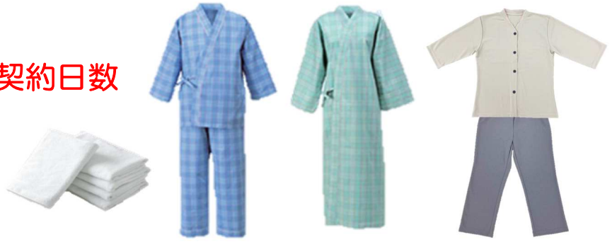
※写真はイメージです 【素材】 寝巻き：綿・ポリエステル混合 タオル：綿100%