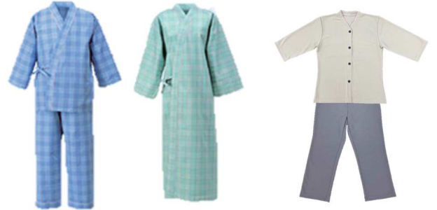
※写真はイメージです 【素材】 寝巻き：綿・ポリエステル混合